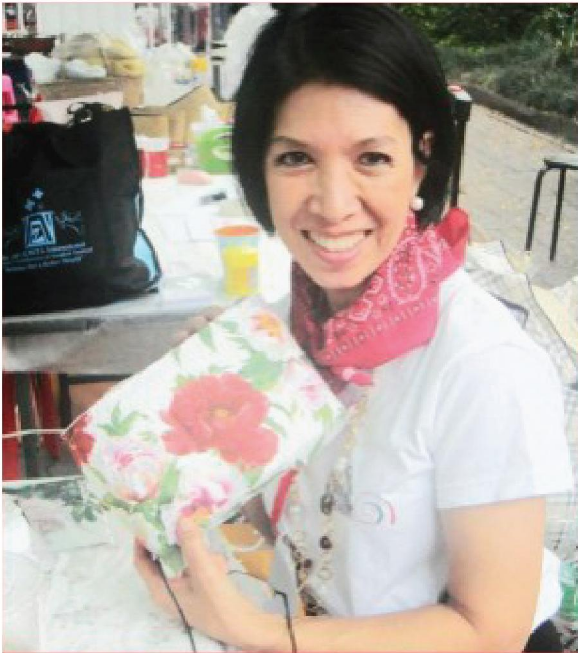
พี่แอน เลือกดอกไม้ English Roses คะ