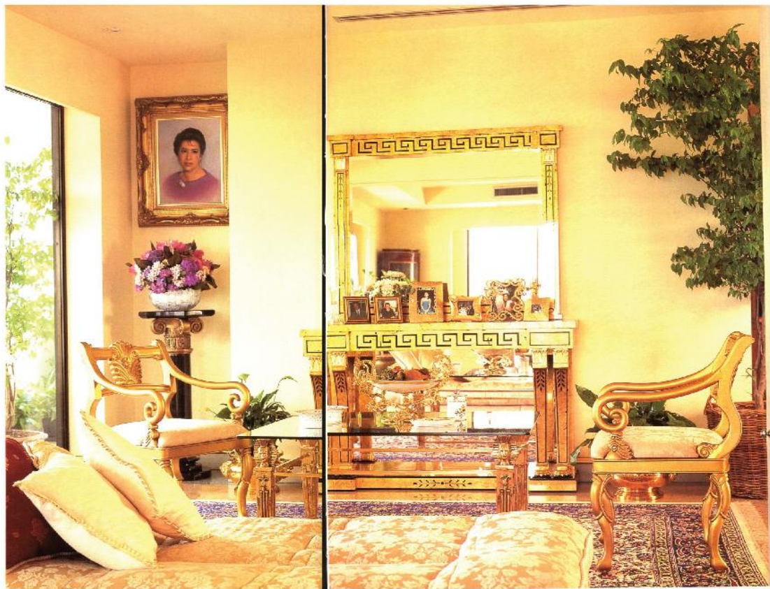
ภาพแสดงการจัดวางของตกแต่งในห้องนั่งเล่น