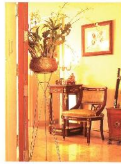
ภาพแสดงการจัดวางของตกแต่งในห้องนั่งเล่น