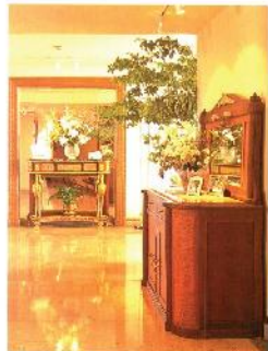
ภาพแสดงการจัดวางของตกแต่งในห้องนั่งเล่น