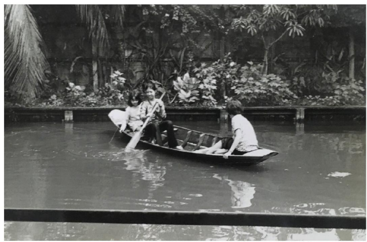
แอนพายเรือบ้านลาดพร้าว ขอยอุทัยทิพย์ ปัจจุบันคือลาดพร้าวขอย 16 บ้านของครอบครัวหุวะนั้นทน์