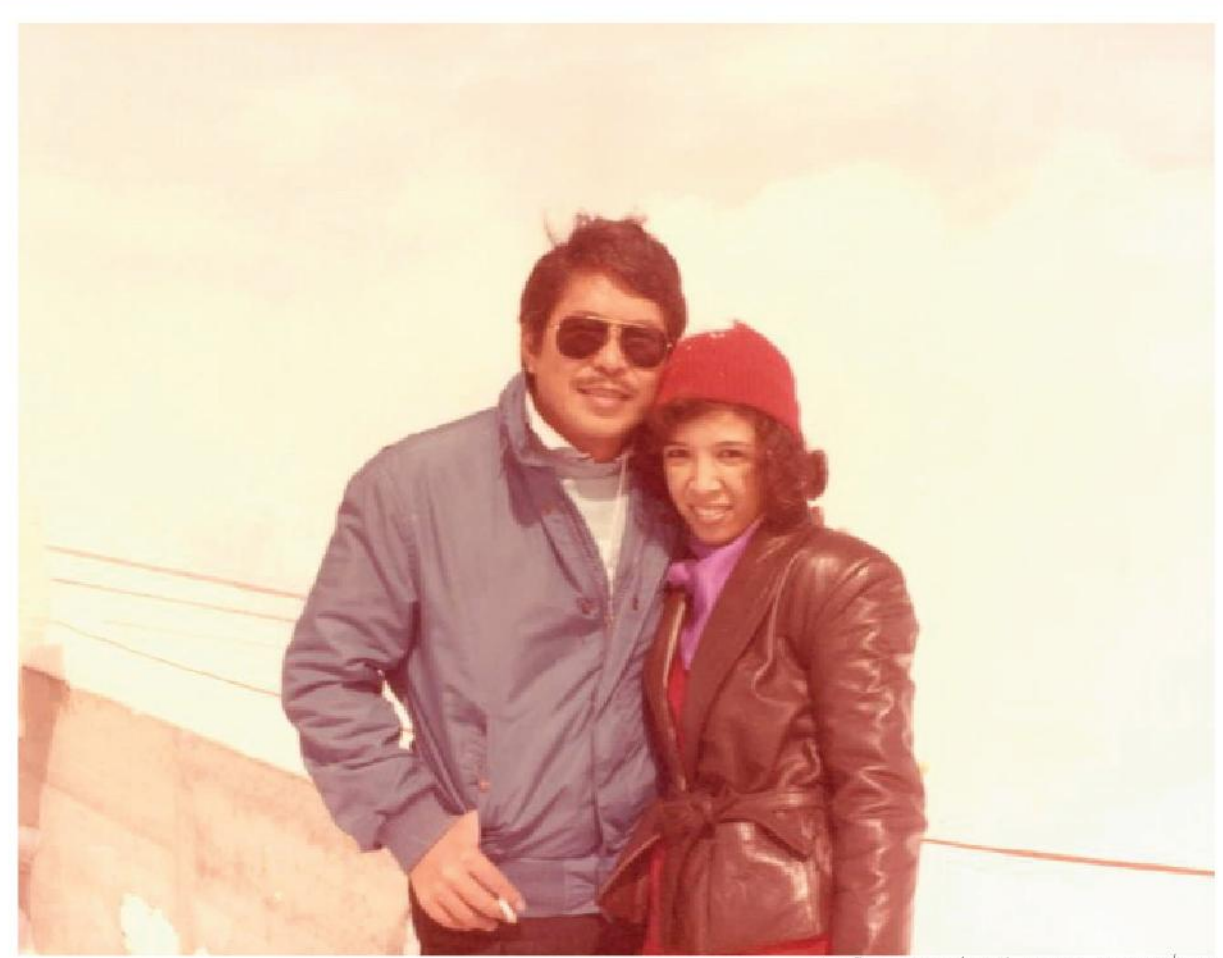
ทริปยุโรป สวิตเซอร์แลนด์, เยอรมัน, อิตาลี, ฝรั่งเศส