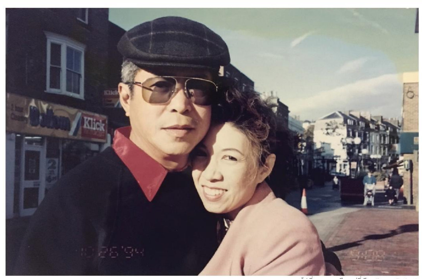
ไปเยี่ยมพลตอนเรียนอยู่ที่เมือง Dover, England